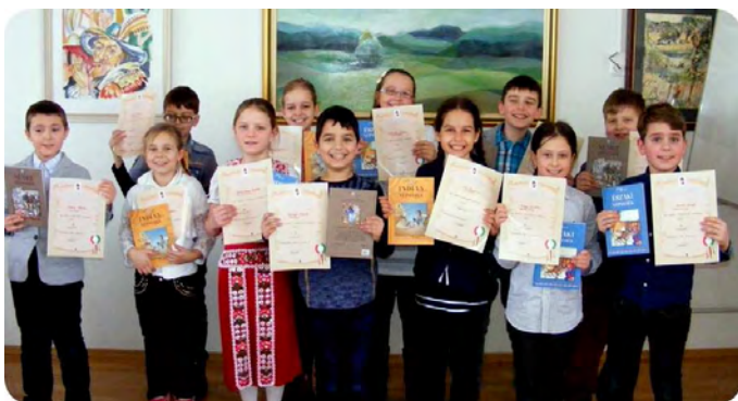
Legeredményesebb alsós mesemondóink (9. oldal)

Az Arany János Általános Iskola negyedik osztályosai színvonalas színpadi műsorral emlékeztek az 1848-as magyar forradalom és szabadságharc 170. évfordulóján. A látványos és érzelmekre ható program összeállítói és rendezői az osztályok pedagógusai voltak.